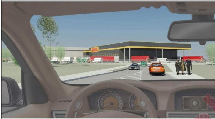
LOGISTICS CENTER <SNIEDZES> STOPINI DISTRICT