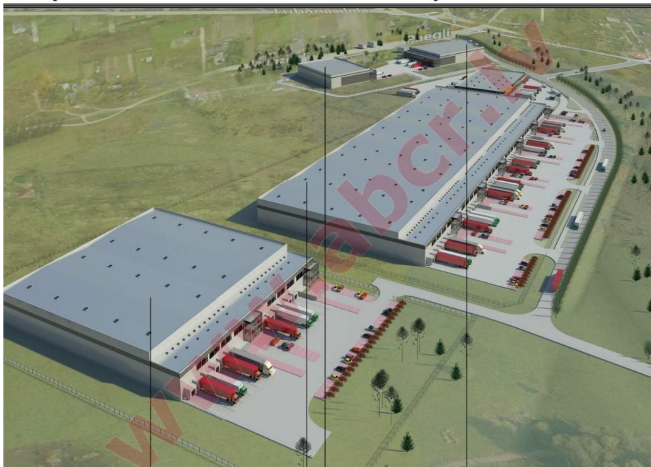
Ēka Nr.1 / Building No.1 / 10 780 m 2