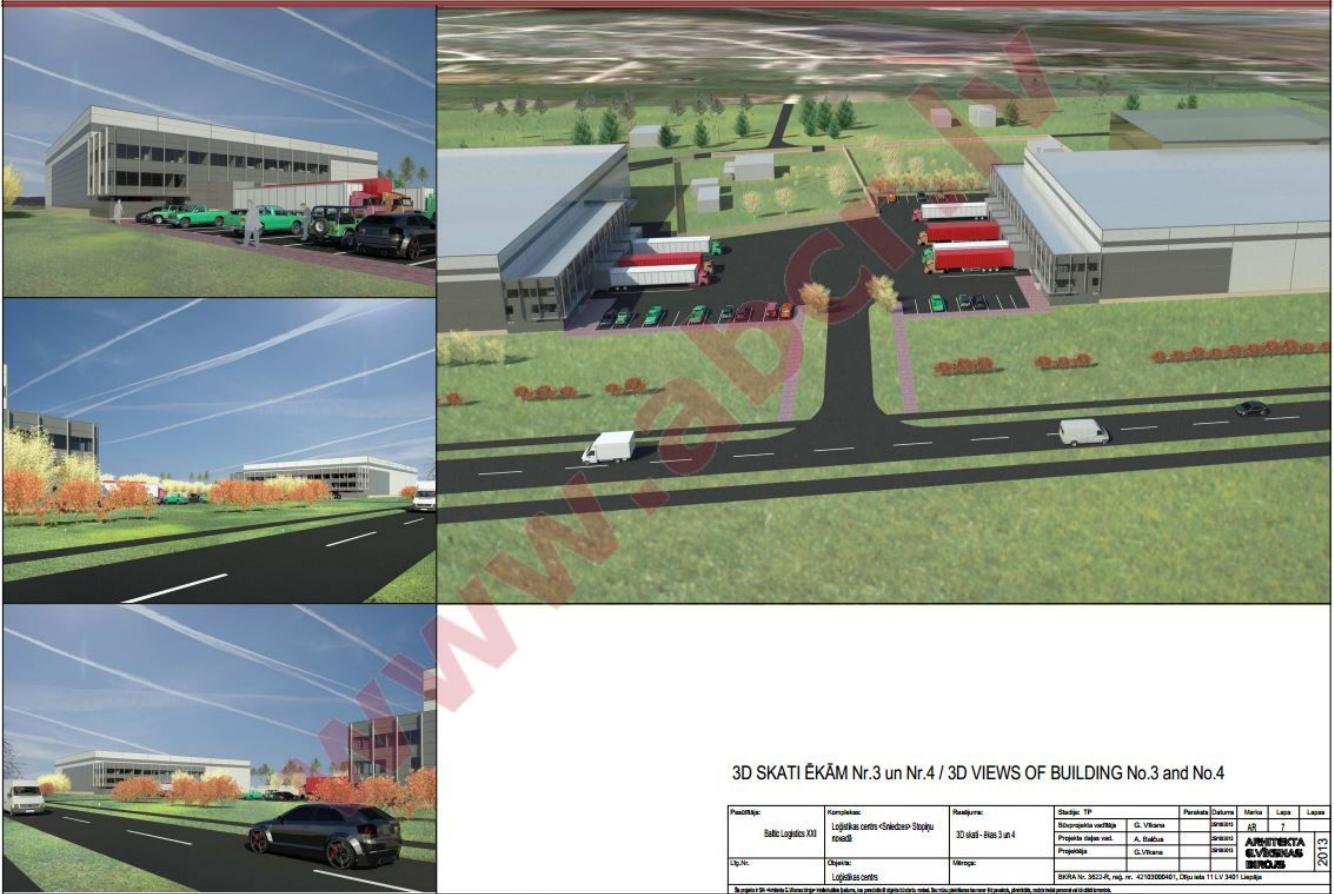
3D SKATI ĒKĀM Nr.3 un Nr.4 / 3D VIEWS OF BUILDING No.3 and No.4