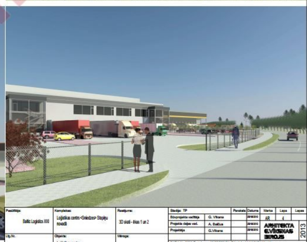
3D SKATI ĒKĀM Nr.1 un Nr.2 / 3D VIEWS OF BUILDING No.1 and No.2